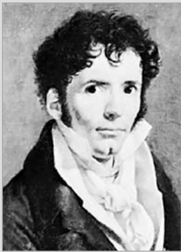
Себастьян-Рош Николя де Шамфор, французский писатель, мыслитель, моралист

основних завдань адвокатури та принципів її діяльності, а також закріплюють єдину систему критеріїв оцінки етичних аспектів поведінки адвоката у дисциплінарному провадженні кваліфікаційно-дисциплінарних комісій адвокатури. Правила адвокатської етики допомагають адвокату як фахівцю вірно обрати лінію поведінки в різних ситуаціях своєї діяльності. За вказаних умов поведінка адвоката в мережі Інтернет має відповідати тим же засадам та принципам, що і поведінка адвоката в реальному житті.